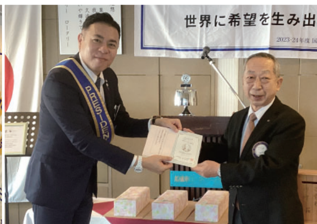
「米山功労者表彰」 山口会員